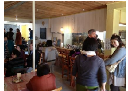
11月1日オープン時の様子 とても暖かく穏やかな日で 沢山の方が来てくれました