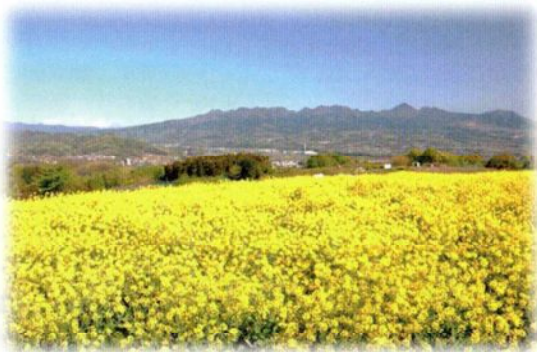
4月～5月中旬 菜の花祭り