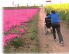
下からの道は結構力が 必要です。