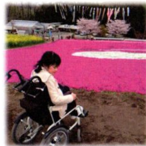
5月下旬まで芝桜も楽しめます。