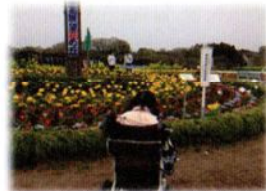
チューリップもきれいですね。