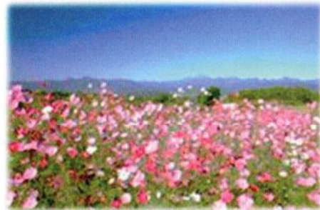
9月下旬～10月中旬 コスモス祭り