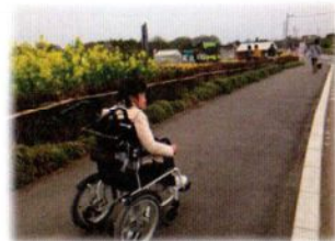
駐車場からの道はきれいに舗装されているので、車いすでも問題ありません。