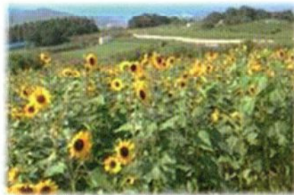
7月中旬～9月中旬 一面のひまわり