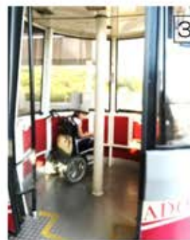
ゴンドラは車いすでも乗車可。係りの方も親切です。