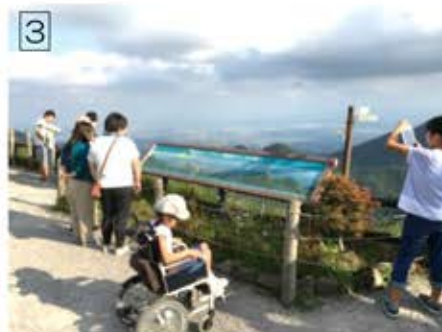
榛名富士の山頂からは関東平野が一望できます。富士山が見えることも。