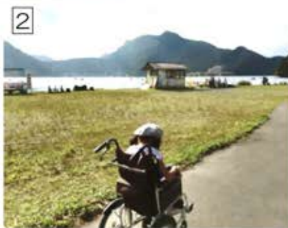
水際には行けませんが湖からの風は十分感じられ気持ちいい。