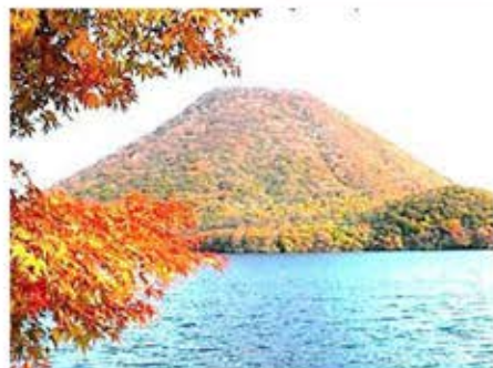
榛名湖の紅葉。 10月中旬～11月中旬が見頃。