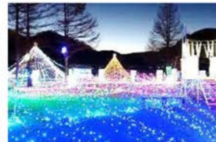
県内トップ人気のイルミネーション。湖面に広がる光が幻想的。12月中。