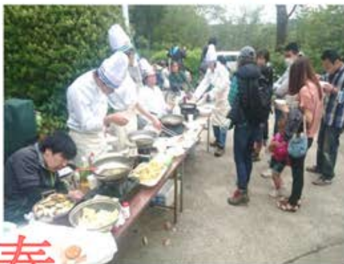
春 4月23日 野外天ぶらが大人気