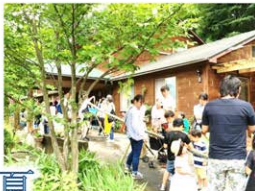
夏 7月26日 大人も子供も流しそうめん