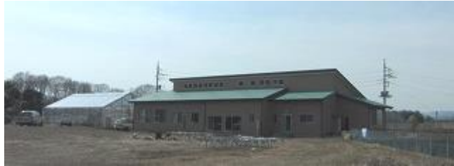
社会福祉法人トモロの森 (2007年開所)